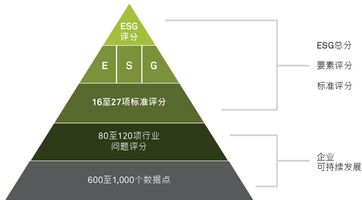
图 1：标普道琼斯指数 ESG 评分的评分点等级