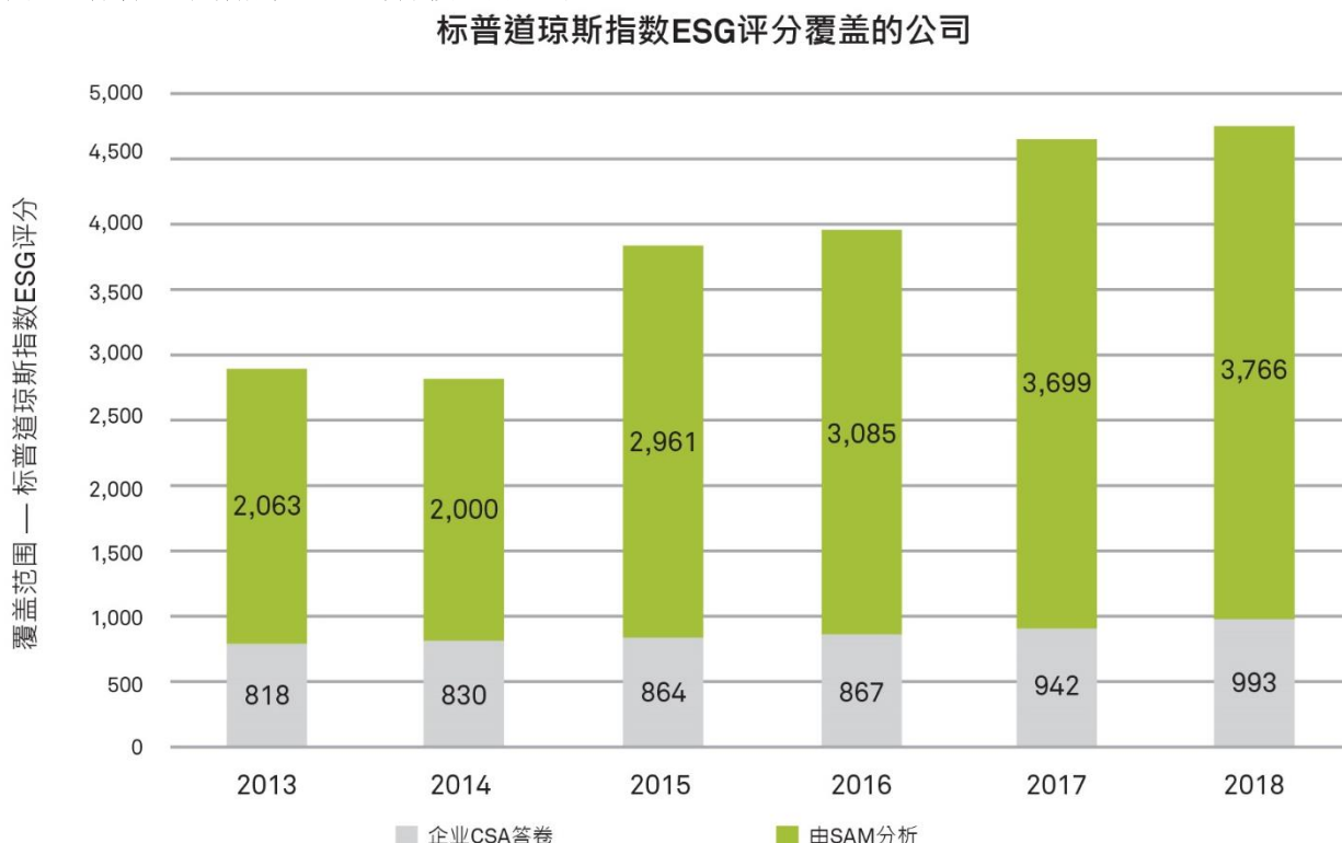
图 2: 标普道琼斯指数 ESG 评分覆盖的公司