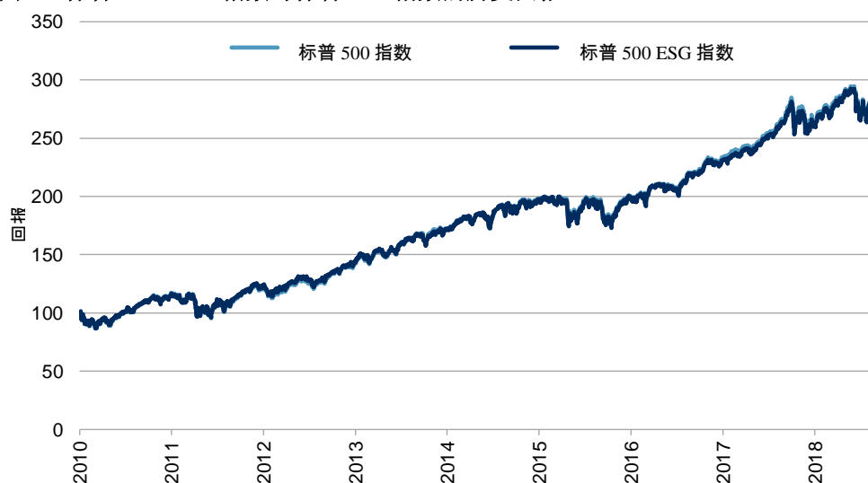
图 6: 标普 500 ESG 指数与标普 500 指数的历史回报

数据截至 2018 年 12 月。过往表现并非对未来结果的保证。图表仅供说明, 反映假设的过往表现。有关回溯测试表现的固有限制的详情, 请参阅本文件末的「表现披露」。