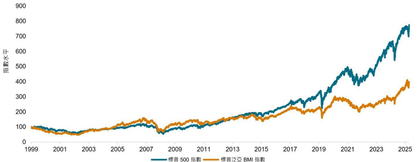
圖 1：標普 500 指數在長期內跑贏標普泛亞 BMI 指數

數據截至 2026 年 4 月 15 日。指數水平於 1999 年 12 月 31 日重新定基為 100。指數表現基於以美元計算的每日總收益。過往表現並不能保證未來業績。圖表僅供說明之用。