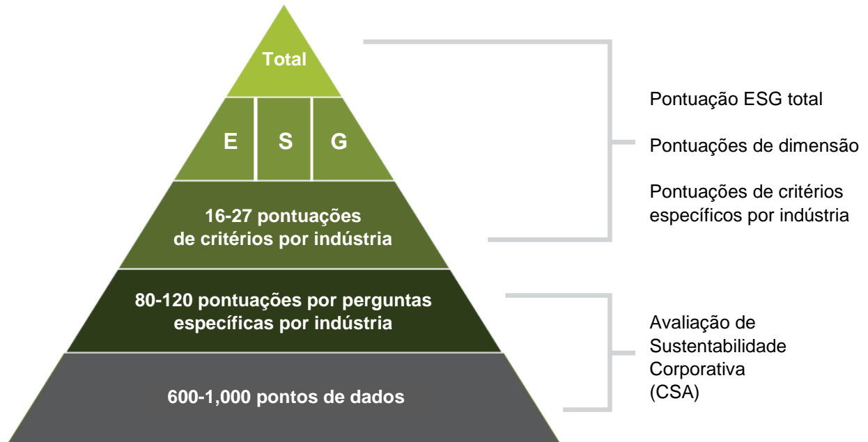
Figura 1: Diferentes níveis das pontuações ESG da S&P DJI

Este quadro é fornecido para efeitos ilustrativos.